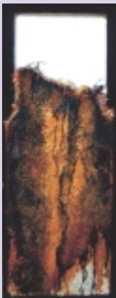
Heraklit – „alles fließt“

Das Gebäude diente von 1786 bis nach dem 2. Weltkrieg als Gefängnis. So sind auch die ehemaligen Zellen zu besichtigen, die vom Künstler neu gestaltet wurden.