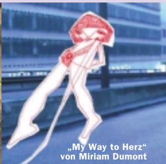
„My Way to Herz“ von Miriam Dumont