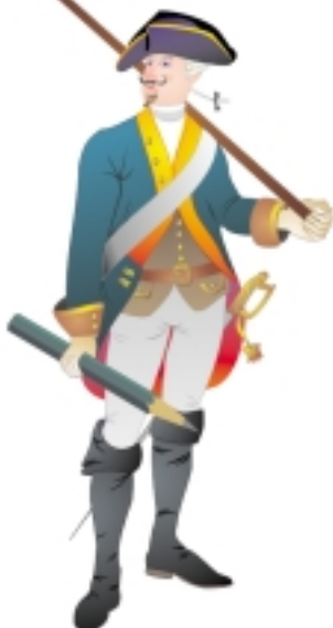
Illustration: Detlev Peipelmann

Kunst und Werbung Dekor- und Produktdesign Porzellanmalerei Corporate Design Public Relations Marketing Multimedia Illustration Kunstmalerie und Unterricht